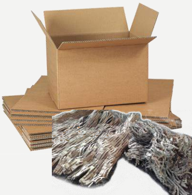
Carton d'occasion, et cartons transformés (produit de calage)