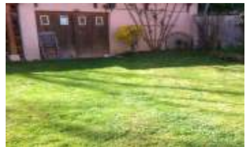
Après tonte sans panier ni ramassage d'herbe!