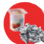
Matières non biodégradables