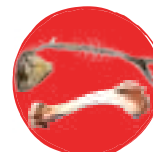
Déchets d'origine animale