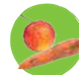
Fruits et légumes abîmés (coupés en morceaux)