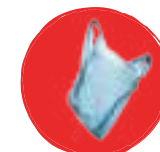
Sacs en plastique, sacs dits «compostables»