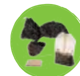
Marc de café et sachets de thé