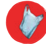
Sacs en plastique, sacs dits «compostables»