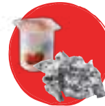
Matières non biodégradables