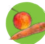
Fruits et légumes abîmés (coupés en morceaux)