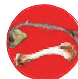
Déchets d'origine animale