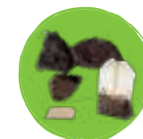
Marc de café et sachets de thé