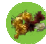
Fleurs fanées (petites quantités)